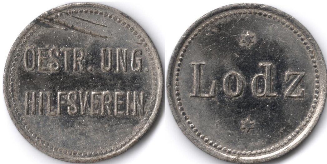
Towarzystwo Pomocy Obywateli Austro-Węgierskich z siedzibą przy ul. Piotrkowskiej 243 1906-1918 r.