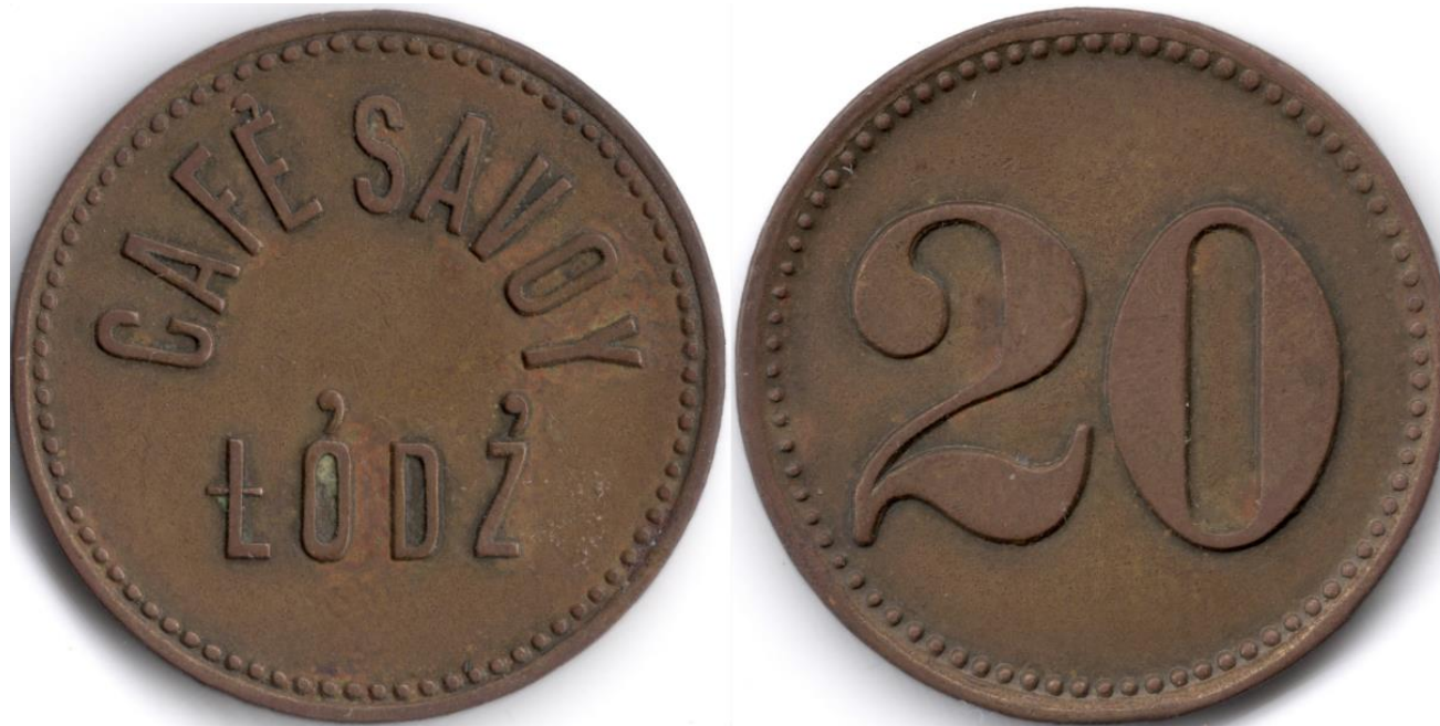
Cafe Savoy przy ul. Krótkiej 6 (ob. ul. Traugutta 6)