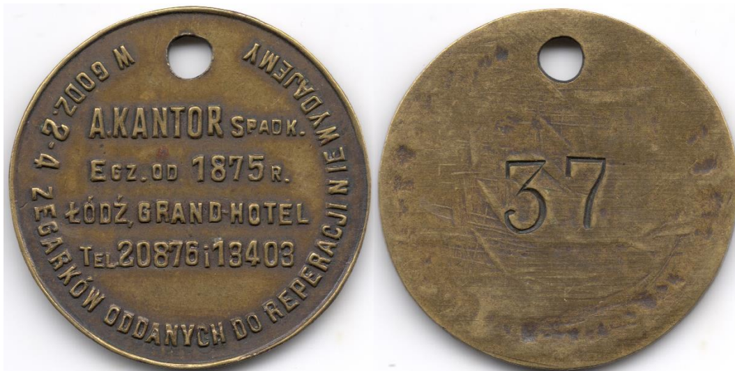
Zakład jubilerski „A. Kantor Spadkobiercy” przy ul. Piotrkowskiej 72 (1928-1939 r.)