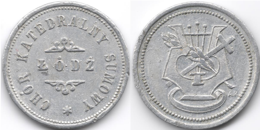
Polski chór Katedralny Sumowy przy kościele św. Stanisława Kostki prawd. 1910-1939 r.