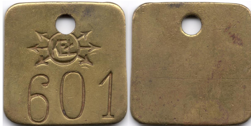
Kolej Elektryczna Łódzka - 1925-1939 i 1945-1948